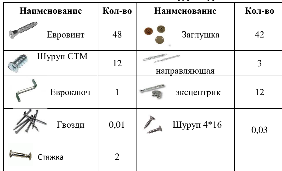
Таблица комплектации фурнитуры