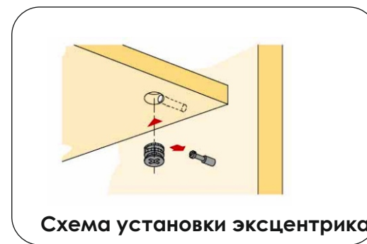
Схема установки эксцентрика